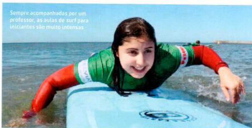
Sempre acompanhadas por um professor, as aulas de surf para iniciantes são muito intensas

“Até quem nunca praticou surf sai da aula de pé sobre a prancha”,