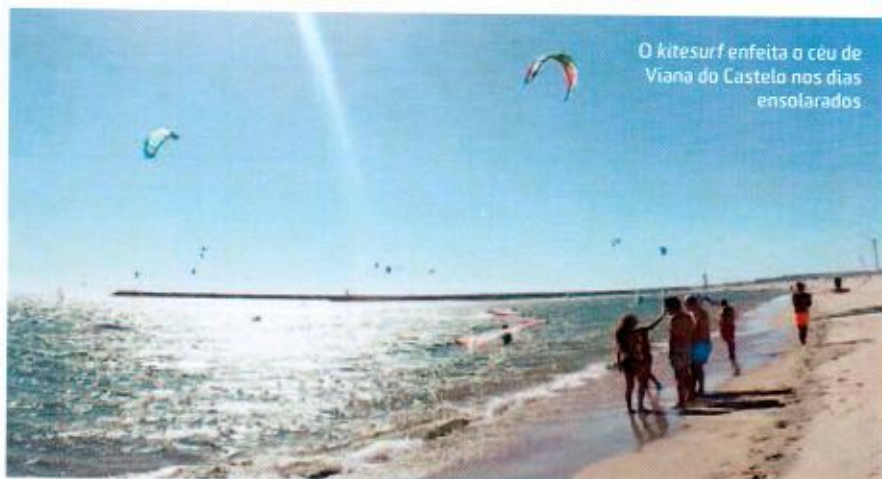
O kitesurf enfeita o céu de Viana do Castelo nos dias ensolarados

“O aluno precisa estar bem posicionado no centro da prancha para conseguir se levantar com facilidade”, explica. É possível alugar prancha, vestuário e câmera esportiva, caso você queira registrar a experiência. Para quem ama pedalar, dá para se aventurar pelas trilhas ou, ainda, passear por toda a extensão das praias da região ou pela cidade, que é super-charmosa, pequenina e segura. Para não correr o risco de se perder, o Sports Center oferece o aluguel de GPS, além de vários perfis de bike . Os trail runners também vão se deleitar com as trilhas no entorno da igreja de Santa Luzia, que são bastante desafiadoras. Se você quer um passeio mais light, vá de trekking para desbravar toda a região.