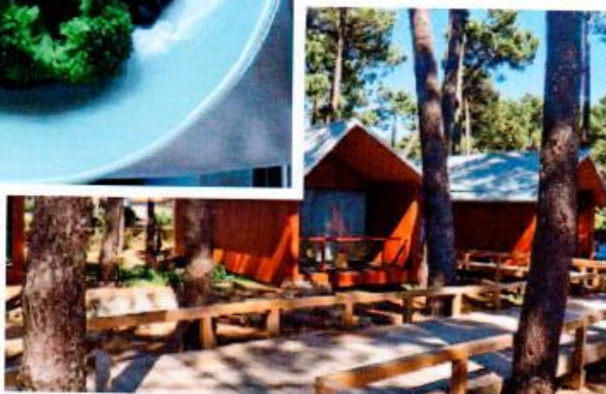
Área dos bangalôs para quem deseja mais privacidade. Ao todo, são 9

A época mais legal para curtir o tempo bonito e quente é entre junho e agosto, durante o verão europeu. Os dias são mais longos e o sol costuma se pôr por volta das 20h30. Mas dá para aproveitar a área fora da temporada: opções para se divertir não faltam