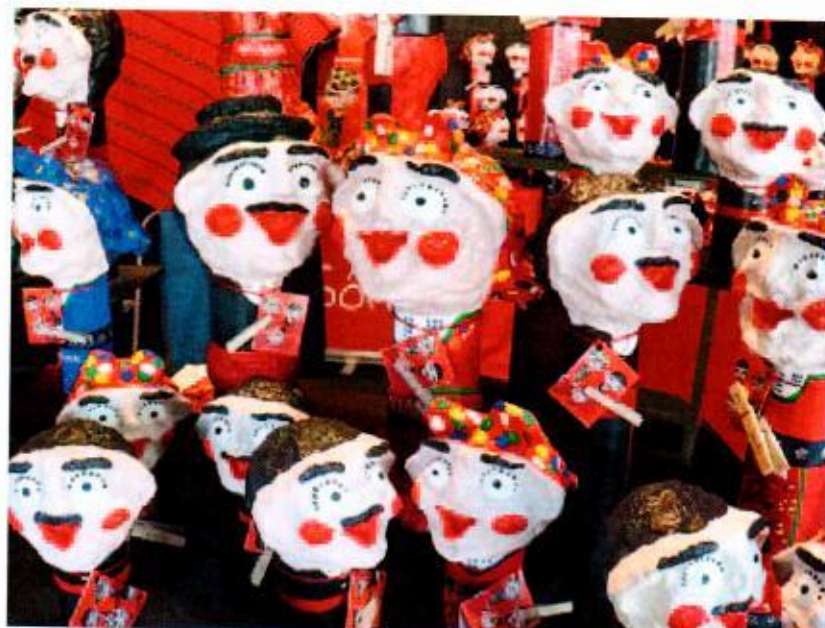
Os bonecos cabeçudos de papel machê são parte da cultura de Viana do Castelo

Viana do Castelo tem cerca de 38 mil habitantes e é um dos berços da cultura portuguesa: seu vestuário colorido, as peças trabalhadas em ouro e os bonecos de papel machê são algumas de suas marcas registradas. Entre pequenas vielas e paredes centenárias, há um forte comércio local que valoriza o artesanato e a culinária variada e rica em frutos do mar. Apesar de preservar suas remotas origens, possui uma alma boêmia – o que não faltam são lugares para curtir a noite afora com a predominância dos barzinhos que servem ótimos drinks e snacks. Come-se bem e bebe-se bem: impossível deixar passar batido o famoso vinho do Porto, originado da cidade homônima que pulsa turismo do mundo todo. Porto fica a cerca de 40 min de carro e seu centro é a cara do centro de São Paulo: a arquitetura herdada dos nossos colonizadores é lembrada em cada esquina da cidade portuguesa, entre igrejas, monumentos, casarões e museus. O rio Douro que banha Porto é muito requisitado para passeios de barco, onde se pode visualizar a cidade de um jeito inesquecível. Não deixe de comprar alguns imãs de geladeira feitos com azulejo português como lembrança para seus amigos!