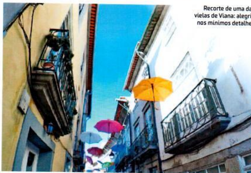
Recorte de uma das vielas de Viana: alegria nos mínimos detalhes