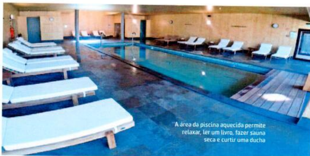
A área da piscina aquecida permite relaxar, ler um livro, fazer sauna seca e curtir uma ducha

Uma das áreas mais legais do hotel, porque você pode fugir do sol e descansar em uma das esteira e dar umas braçadas sem precisar enfrentar as águas geladas do mar. Na mesma área da piscina está a sauna seca, toda feita de madeira.